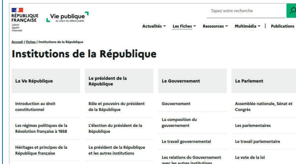
vie-publique.fr Au cœur du débat public

Dans le cadre de sa mission générale d'accès du citoyen à la vie publique et au débat public, le site vie-publique.fr informe et éclaire sur le fonctionnement des institutions, des politiques publiques et apporte les clés de compréhension pour suivre les grands sujets qui animent le débat public à travers des fiches, des documents multimédias, des actualités et la collection des discours et rapports publics.