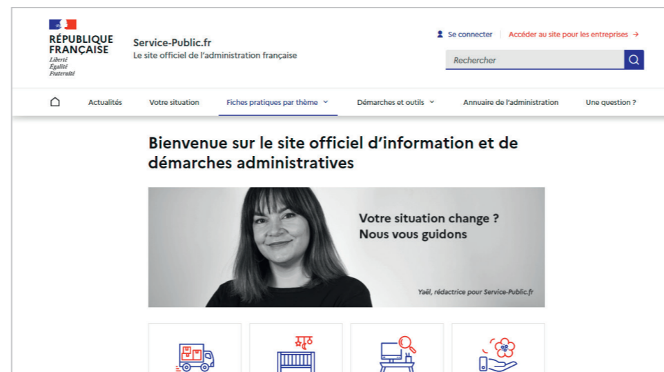
service-public.fr Le site officiel de l'administration française

Créé en 2000, service-public.fr a pour mission d'informer l'utilisateur et de l'orienter vers les services qui lui permettent de connaître ses obligations, d'exercer ses droits et d'accomplir ses démarches administratives en s'orientant au sein des services de l'administration. Il permet d'exécuter en ligne de nombreuses démarches de la vie quotidienne, de créer un compte personnel, d'accéder à des simulateurs de situation, des recherches guidées personnalisées et à l'annuaire de l'administration (70 000 guichets locaux des services publics).